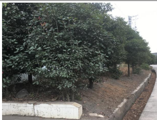
厂区路边植被恢复